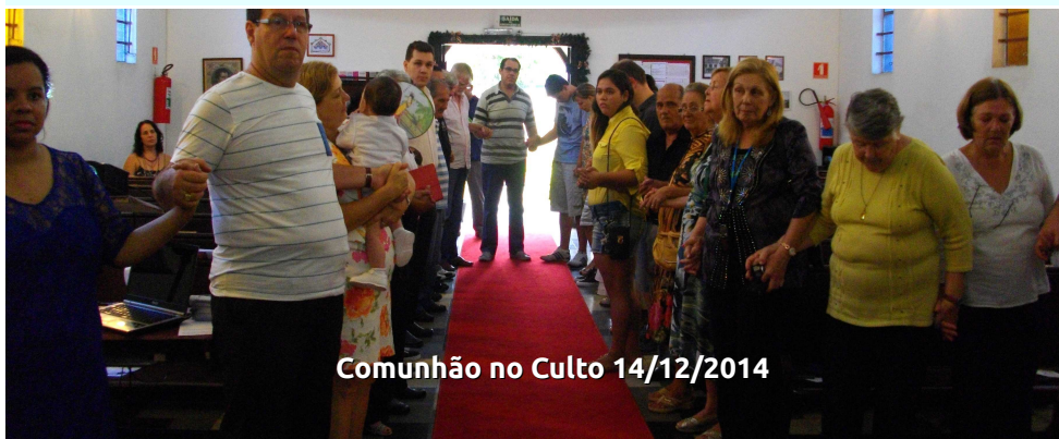
Comunhão no Culto 14/12/2014

“Pastor, quando vou ao culto quero ficar leve, e muitas vezes isto realmente acontece.” “Que bom,” respondo, “tomara que seja sempre assim!” “Verdade, mas tem um problema: Se o fulano xy está lá, fico mais tenso ainda porque com ele não tem jeito.”