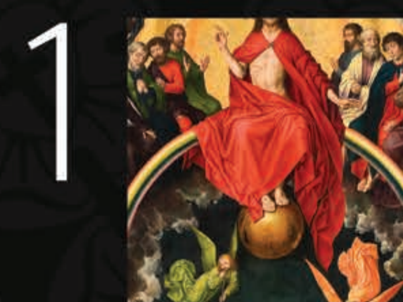
No painel central vemos Jesus Cristo como Juiz sentado em um arco-íris (Apocalipse 4.3).