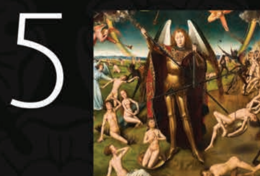
Embaixo de Jesus está o Arcajo Miguel com a função de julgar as almas.