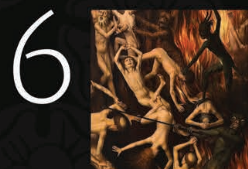
No painel da direita, as almas condenadas são arrastadas por demônios para o inferno.