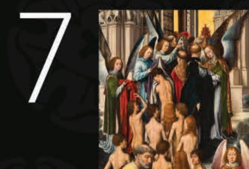
No lado esquerdo as almas salvas são acolhidas pelo apóstolo Pedro e recebem novas roupas (nova Jerusalém).