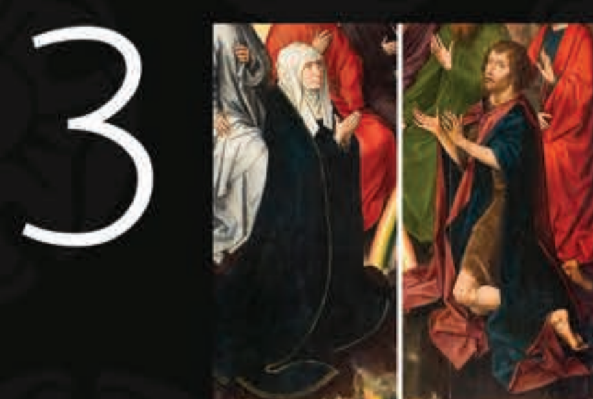
À sua direita ajoelha-se Maria, à sua esquerda, João Batista com o seu manto de pele.