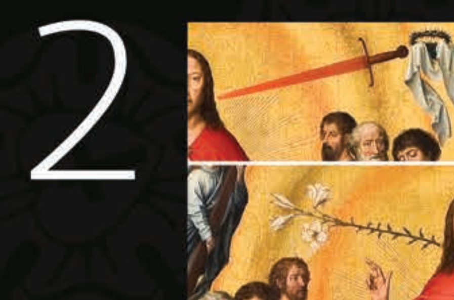
Um lírio e uma espada estão à esquerda e à direita da sua boca e indicam os lados das pessoas salvas e condenadas, respectivamente.