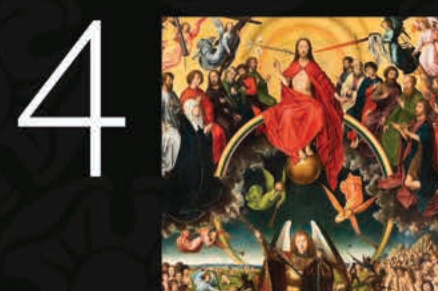
Em um semicírculo estão os doze apóstolos.