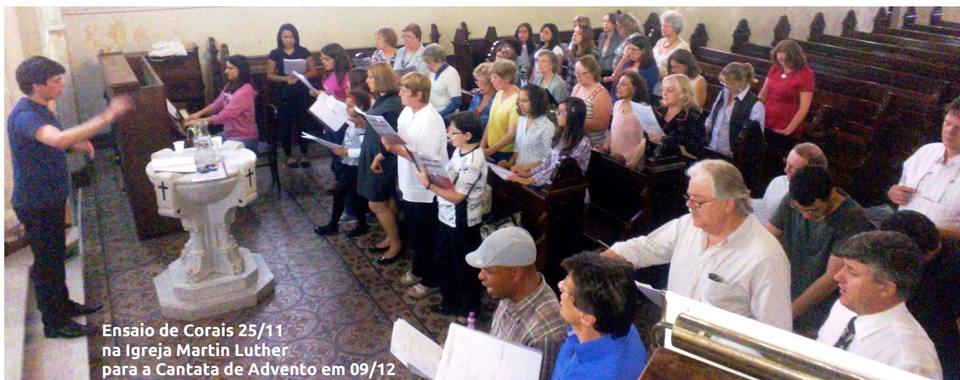
Ensaio de Corais 25/11 na Igreja Martin Luther para a Cantata de Advento em 09/12