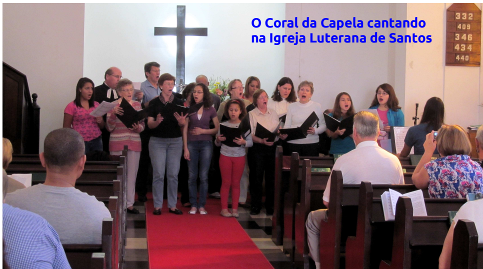
O Coral da Capela cantando na Igreja Luterana de Santos