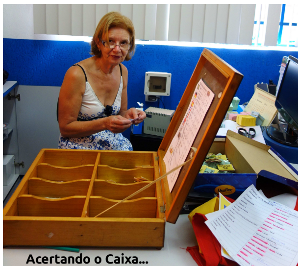
Acertando o Caixa...

Nesta edição nossa ênfase está no desenvolvimento das contribuições regulares dos últimos três anos: