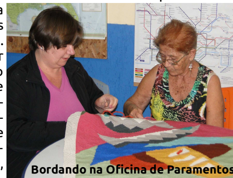
Bordando na Oficina de Paramentos

No nosso dia a dia geralmente somos um tanto “egoístas”. E não vamos dizer que não, porque o próprio instinto de conservação e sobrevivência nos faz pensar primeiramente em nós mesmos. Cuidar de nossa família, zelar pelo nosso pa-