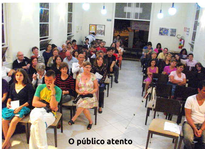
O público atento

refeição a base de frango junto a um copo de vinho ou outra bebida.