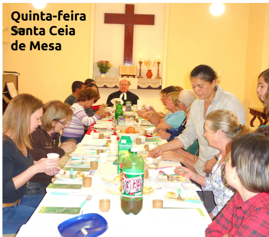
Quinta-feira Santa Ceia de Mesa

É notável a participação da comunidade apesar do feriado e tempo bom. As fotos falam para si mesmas: