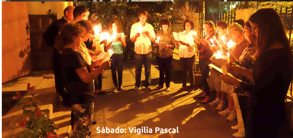
Sábado: Vigília Pascal