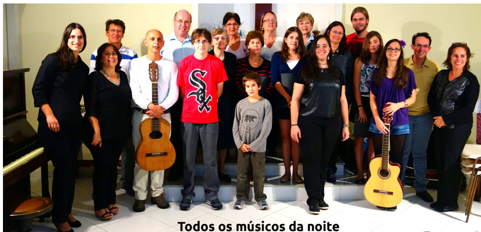
Todos os músicos da noite