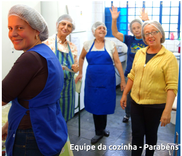
Equipe da cozinha - Parabéns

Tudo isto só foi possível graças ao empenho de um grande número de colaboradores que fizeram este dia desde sua preparação até a guarda da última cadeira no fim de festa. Muito obrigado! Fizemos um tremendo bem a nós mesmos!