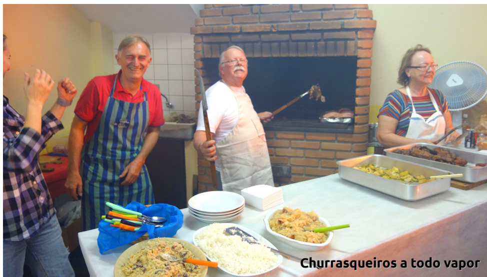
Churrasqueiros a todo vapor