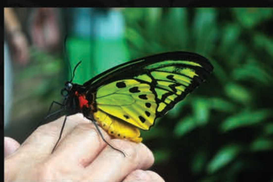
A Reforma liberta a pessoa: justificados pela fé somente.