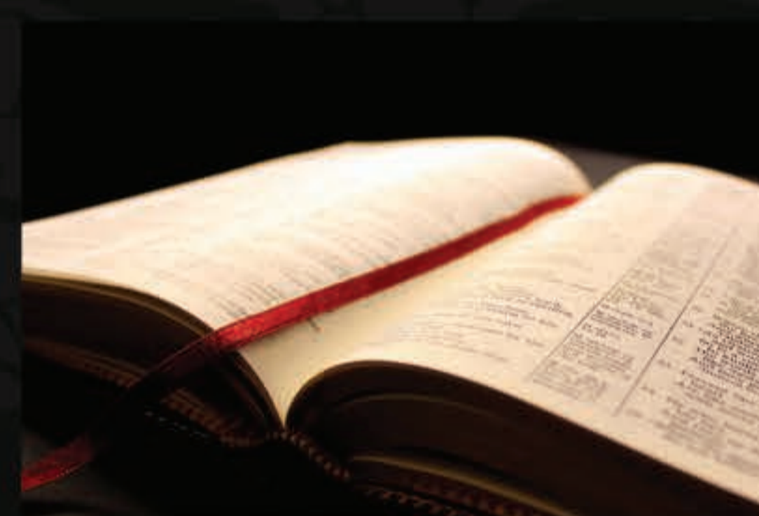
A Reforma dá ao povo acesso ao texto bíblico.