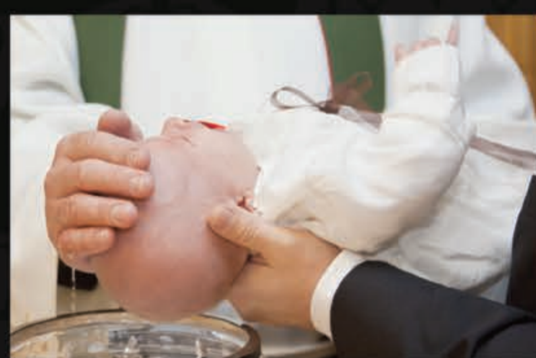
A salvação é o ponto de partida da vida de fé, não o ponto de chegada.