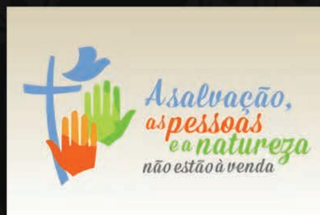
Detalhe do cartaz do lema da IECLB 2016

O Evangelho liberta a pessoa. As pessoas movidas por sua fé faziam o bem esperando serem recompensadas aqui e na eternidade. Ao apontar para a morte e ressurreição de Cristo como ação primeira, a Reforma afirma: Cristo nos libertou. Portanto, somos pessoas livres, a ninguém sujeitas. Nem mesmo ao mal. E na medida em que somos livres, somos livres para a boa ação realizada por amor (não por obrigação ou mérito). É assim: o bem que recebi de Cristo quero, por gratidão, oferecer para a outra pessoa. Isto é ser livre – livre para fazer o bem.