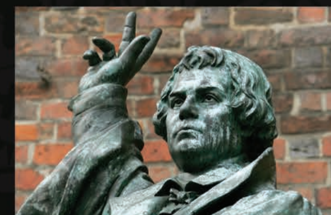
A Reforma liberta a fé da pessoa: somos livres para expressá-la.