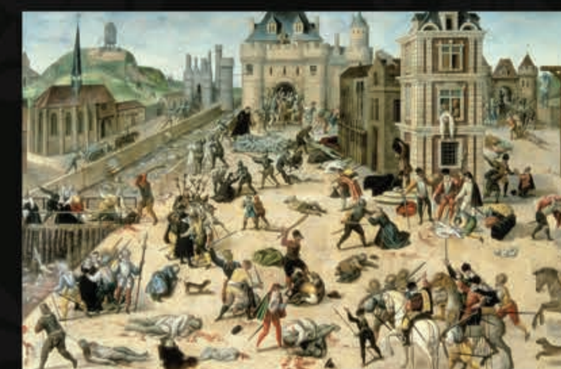
Outras guerras religiosas aconteceram na Europa: estima-se que cerca de 30 mil protestantes foram mortos por heresia na Inglaterra entre 1554 e 1558.