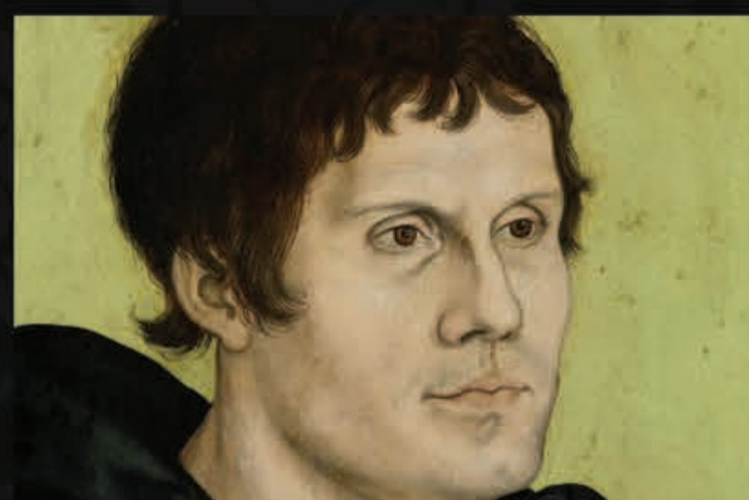
Lutero e o povo judeu: mais mortes em nome da fé.