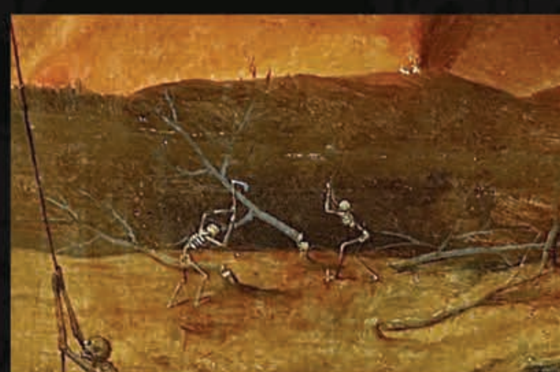
Reivindicação dos camponeses: direito de cortar lenha no bosque para uso pessoal, especialmente no frio do inverno.

Lutero escreve dois textos acerca do povo judeu: o 1º (1523) de grande simpatia quando manifesta compreensão no sentido de que venham a crer na verdade revelada do Evangelho. O segundo (1543) é sem confiança. A conversão esperada não aconteceu. Pior: circulam boatos de supostas difamações ao nome de Cristo. Lutero então sai em defesa da fé cristã (não do humano). E sua defesa é o ataque: é preciso resistir às falsas doutrinas.