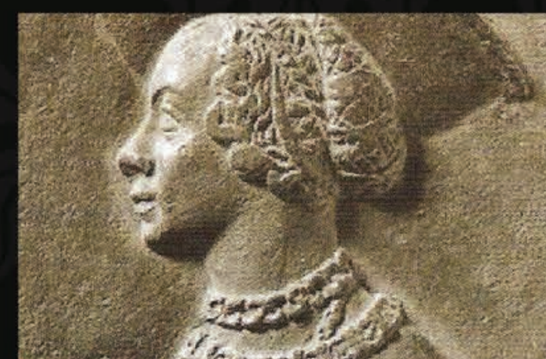
Argula von Grumbach

Katharina von Bora, a "Lutera" (1499-1552). Em 1525 a ex freira se tornou a esposa de Martim Lutero. Administrou com astúcia a casa da família onde ficavam alojados cerca de 40 estudantes da Universidade de Wittenberg. Assumiu o papel de chefe de finanças e supervisionou a impressão das obras de Lutero. Conquistou respeito não só por sua perspicácia financeira, mas também por seus pronunciamentos espirituais e inteligentes nas Conversas de Mesa e em suas cartas. Evangelho liberta a pessoa. As pessoas movidas por sua fé faziam o bem esperando serem recompensadas aqui e na eternidade. Ao apontar para a morte e ressurreição de Cristo como ação primeira, a Reforma afirma: Cristo nos libertou. Portanto, somos pessoas livres, a ninguém sujeitas. Nem mesmo ao mal. E na medida em que somos livres, somos livres para a boa ação realizada por amor (não por obrigação ou mérito). É assim: o bem que recebi de Cristo quero, por gratidão, oferecer para a outra pessoa. Isto é ser livre – livre para fazer o bem.