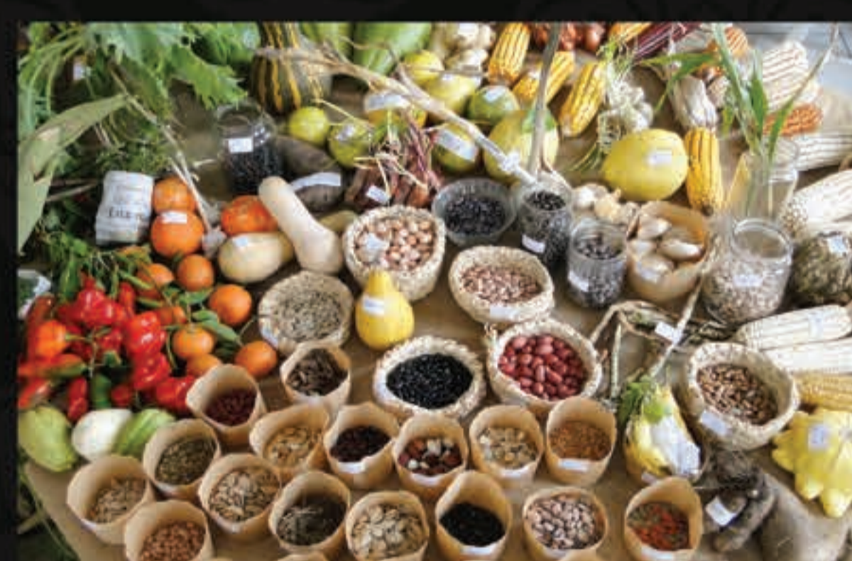
Cuidar da criação com produção e consumo de produtos sustentáveis – CAPA (Centro de Apoio e Promoção da Agroecologia).