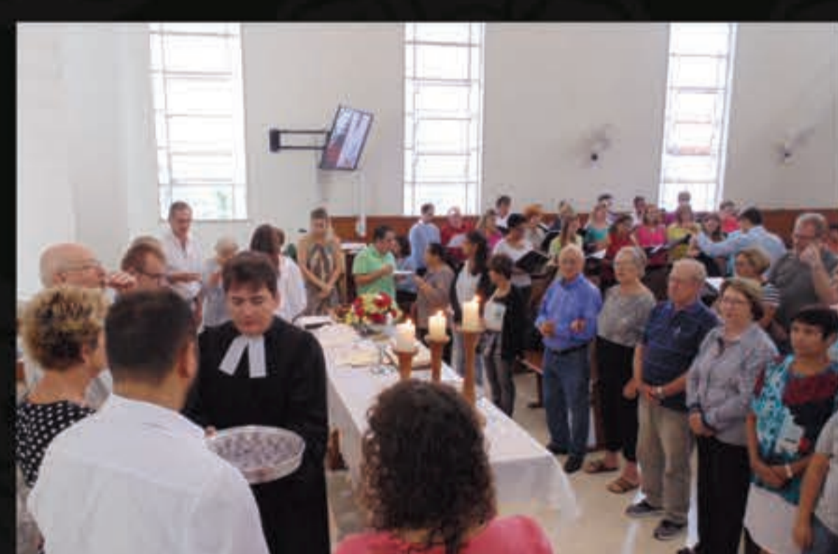
Protestantes celebram a fé em culto.