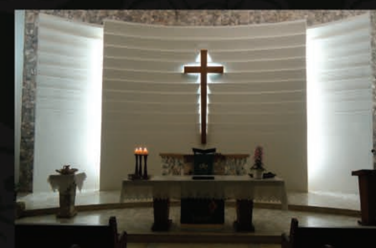
A pessoa protestante crê na promessa da vida eterna.