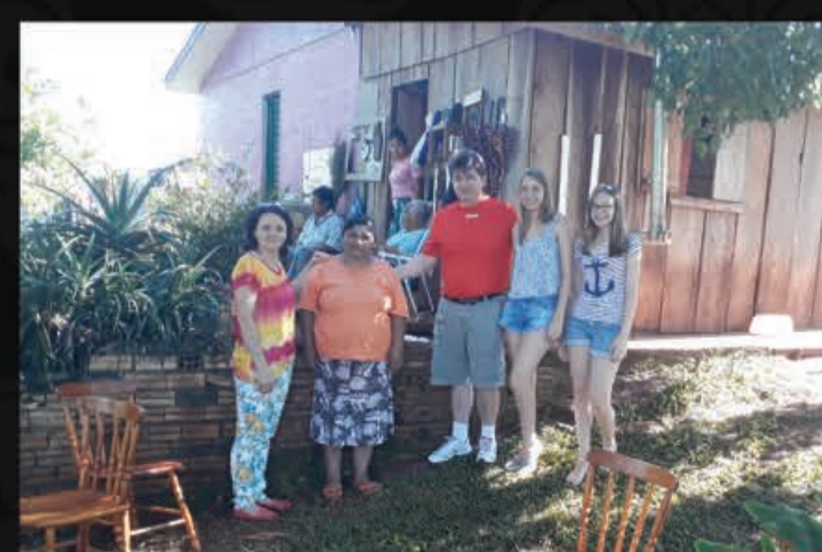
O COMIN (Conselho de Missão entre os Indígenas) é o braço de atuação da Igreja Luterana nas reservas indígenas do Brasil.