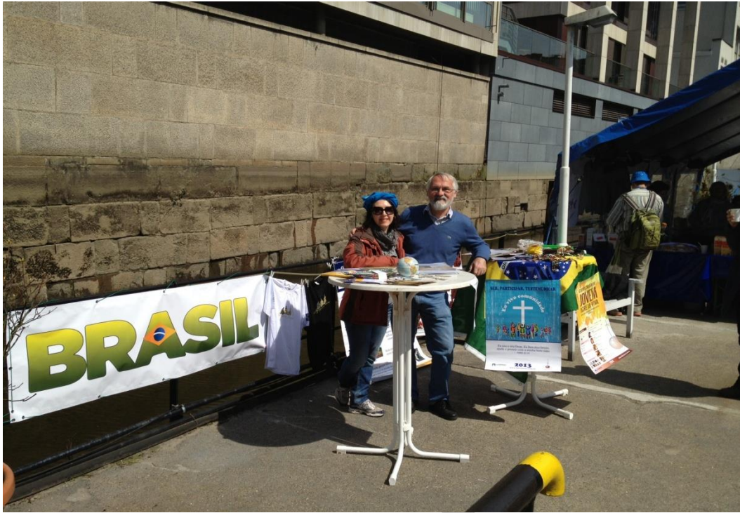
Nosso estande num navio durante o Kirchentag