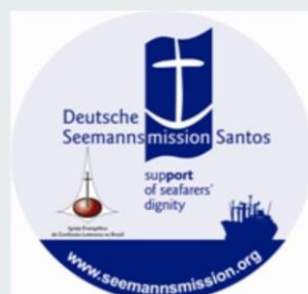
MISSÃO AOS MARINHEIROS SANTOS/SP

ENCONTRO DE PRESIDENTES, TESOUREIROS/AS, E SECRETÁRIOS/AS DO SÍNODO SUDESTE