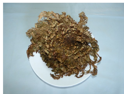
No dia 27/4 celebramos um Culto Familiar da Páscoa, no qual uma Rosa de Jericó nos ajudou a compreender o milagre da Ressurreição de Cristo, e, logo após o Culto, realizamos um Galetto Paroquial