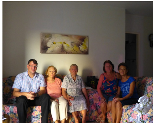
Algumas Fotos dos Cultos da Semana Santa na Bom Pastor, na Castelo Forte e no Bom Mestre