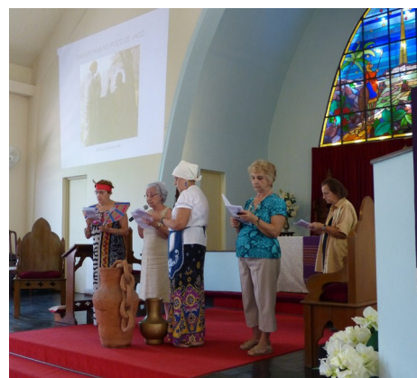
Celebração do Dia Mundial de Oração na Catedral Anglicana do Redentor/Tijuca no dia 7/3