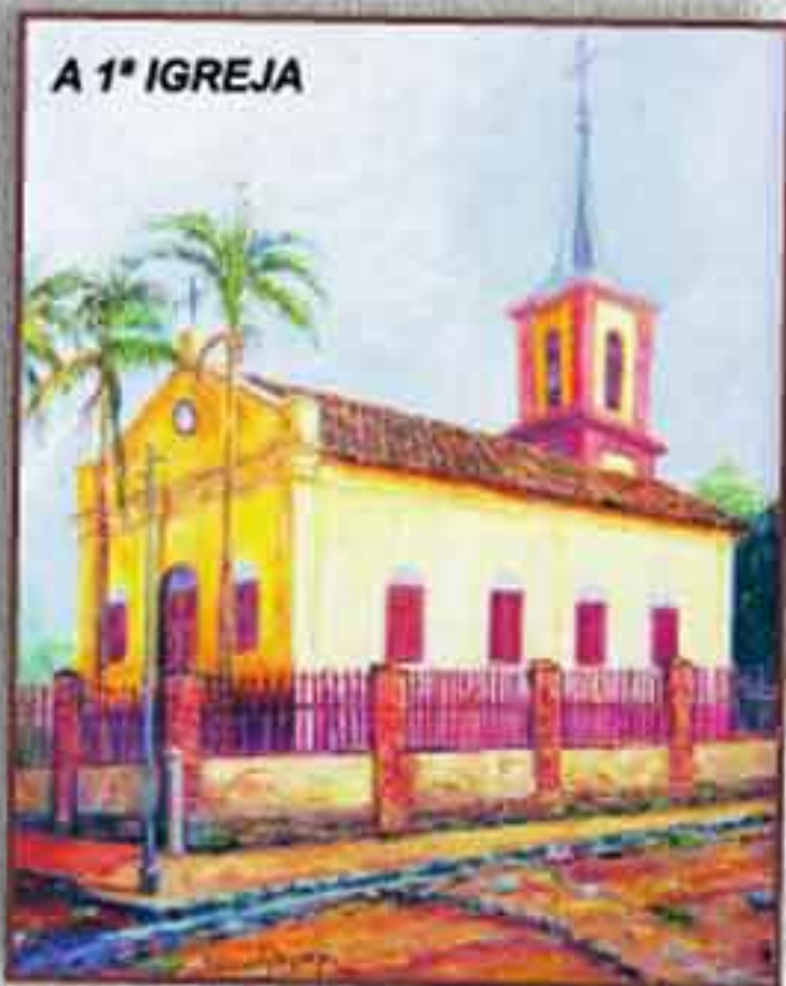
A 1ª IGREJA

No dia 22 de setembro de 1883, às 8h da manhã, foi realizada a cerimônia da pedra fundamental. O Pastor Zink realizou uma pequena alocução com base no texto de Isaías 28.16: "Vede em Sião, colocamos uma pedra fundamental".