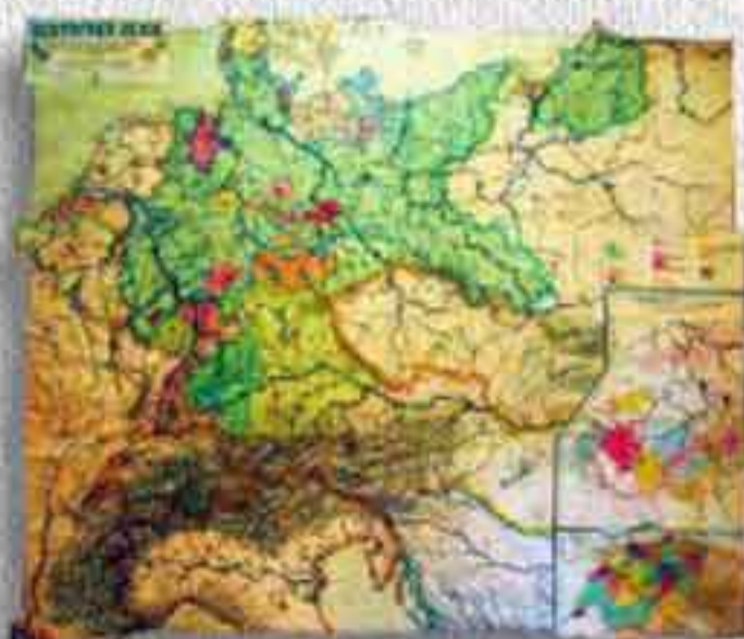
Mapa antigo da Alemanha