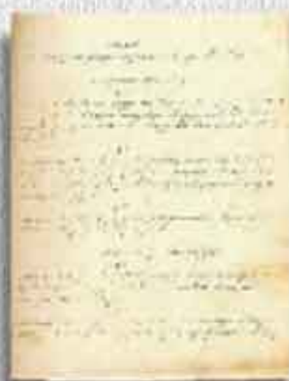
Estatuto - 1906

Este dado histórico revela que a Comunidade já tinha um estatuto,