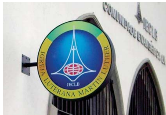
A Igreja renovou sua identidade: cores mais vivas e brasileiras no letreiro da fachada.

E assim, as novas gerações procuram fazer com que a Igreja Martin Luther acompanhe a marcha do progresso da história, agora no século XXI, mas sempre tendo em mente os princípios evangélicos defendidos pelos reformador Martin Luther, cujo nome honra o templo: somente Cristo, somente a fé somente a graça somente a Bíblia.