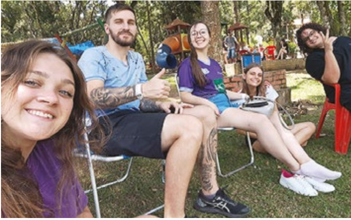
Durante quatro dias, a Juventude se reuniu para compartilhar momento de comunhão e descontração