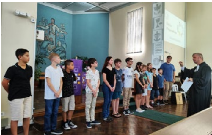
Culto de apresentação foi um momento marcante para os jovens e suas famílias

Rogamos que seja um tempo abençoado e de muita comunhão, partilha e fé, e que os preparando tenham em sua comunidade uma extensão de sua casa. Deus esteja com eles.