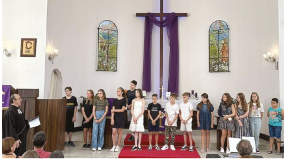
Momento foi marcante para todos que iniciam a caminhada no Ensino Confirmatório

Entre as várias iniciativas que buscam despertar esse sentimento de amor pela sua comunidade e pela IECLB, os confirmandos e preparandos da Paróquia Cristo Bom Pastor foram convidados a estarem presentes no Culto de Apresentação do Ensino Confirmatório, realizado no dia 3 de março. A comunidade é responsável, ao lado de pais, mães, padrinhos e madrinhas, na formação da espiritualidade cristã destes jovens, por isso, precisa estar presente e atuante também ao longo deste importante período na vida destes adolescentes e suas famílias.