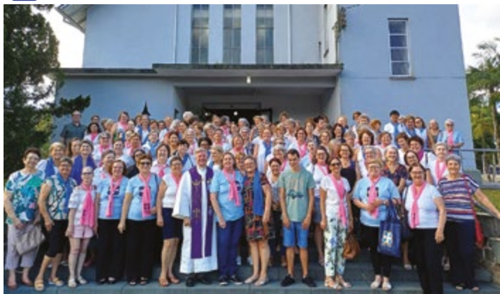
Mais de 170 mulheres se reuniram na Par. Cristo Redentor para orar pela Palestina