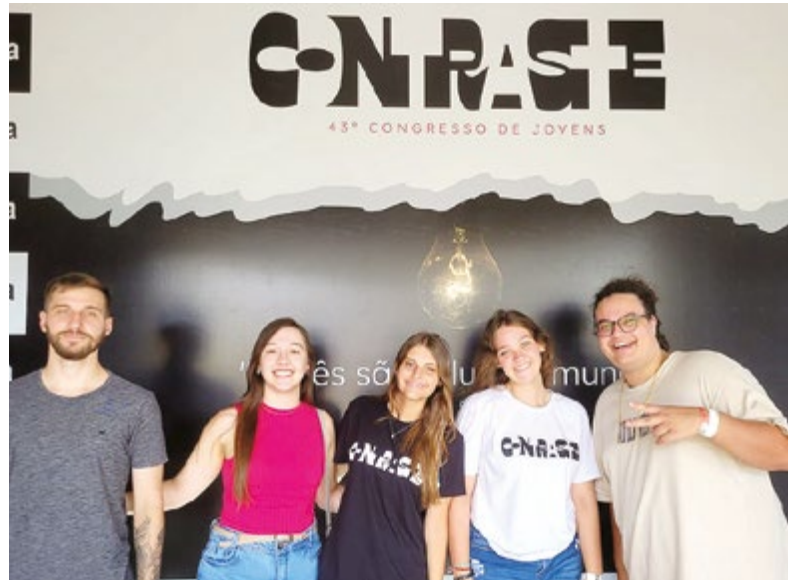
Jovens participaram de palestras, seminários e ministérios da igreja

Foram quatro dias intensos, onde conhecemos diversas juventudes, fizemos novos amigos, louvamos ao Senhor, ficamos na presença Dele. Foi um momento de muita comunhão, mas também de dar boas risadas e de prestigiar outras juventudes nos jogos do congresso. Tivemos a experiência de participar de palestras, seminários sobre louvor e ministérios na igreja. Foi um feriado de bênçãos e realizações, e esperamos ansiosamente pelo 44º Congresso de Jovens!