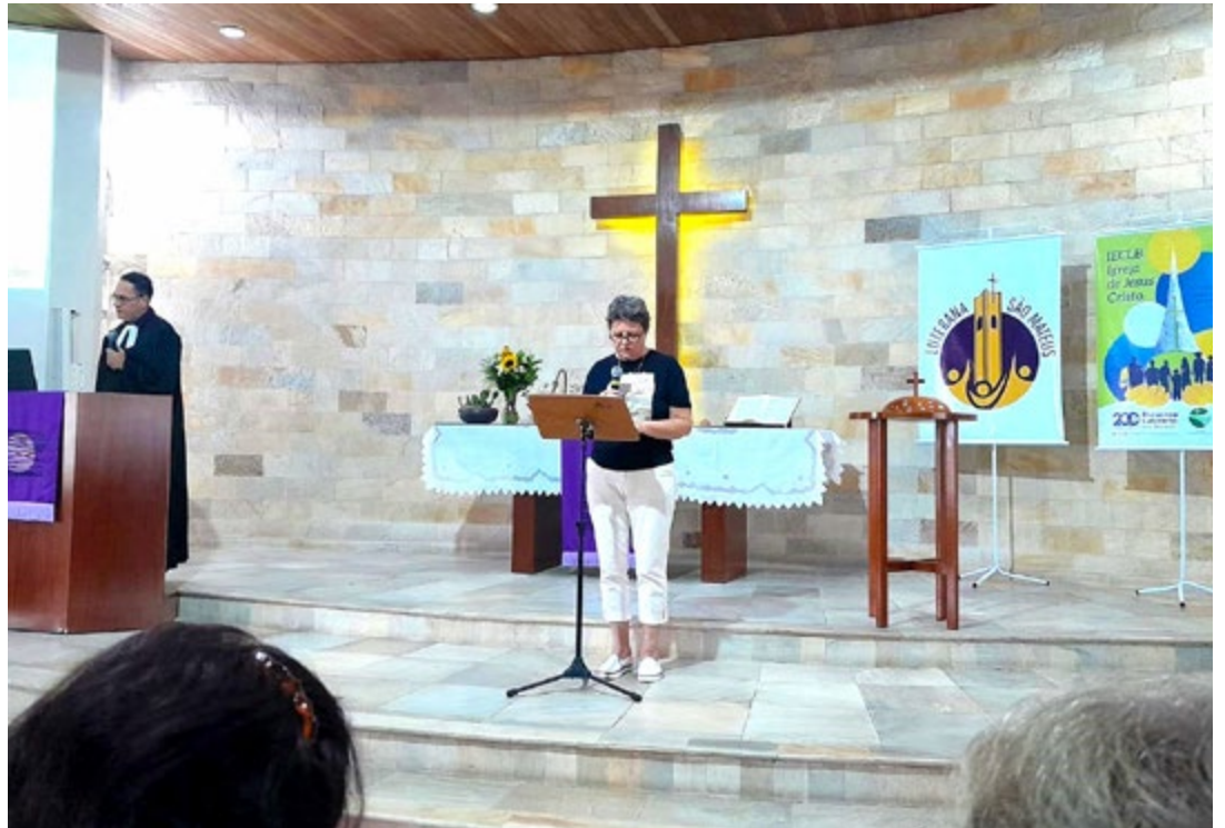
Culto do Dia Mundial da Oração marcou reinício das atividades da OASE

O tema do culto foi um chamado aos dois povos a se suportarem em amor, como também a nós em quaisquer conflitos com outras pessoas e grupos. O texto bíblico, base do tema, foi Efésios 4.1-7, des-