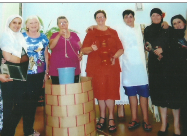
OASE São Miguel do Oeste