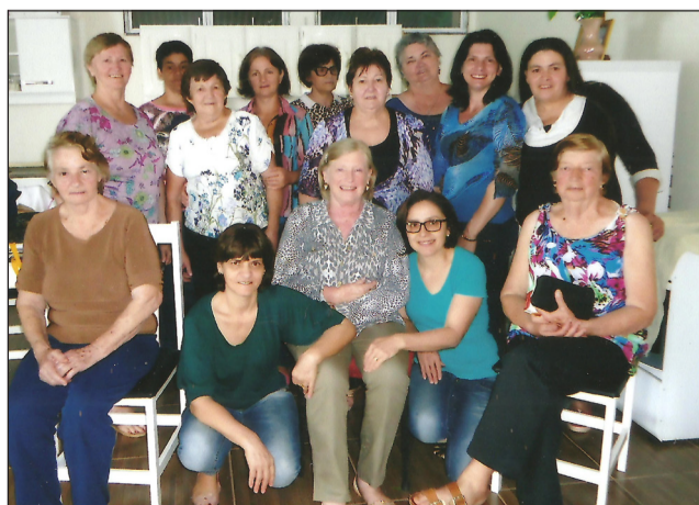
OASE São Miguel do Oeste