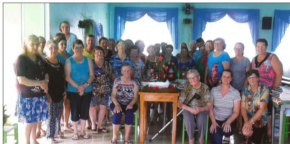
Salgado Filho PR

fixou moradia junto à casa Paroquial da cidade de SMO, onde já se constituía a maior comunidade na época. Em plena época de desbravamento