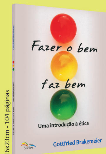
Fazer o bem faz bem Uma introdução à ética