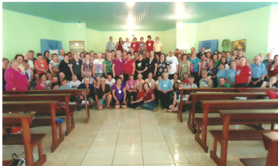
Dia Paroquial OASE Set 2017 Salgado Filho