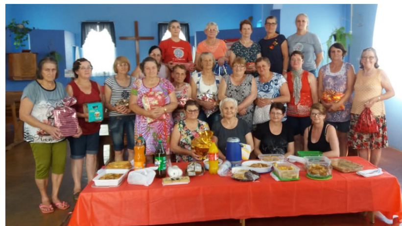
Guarujá do Sul