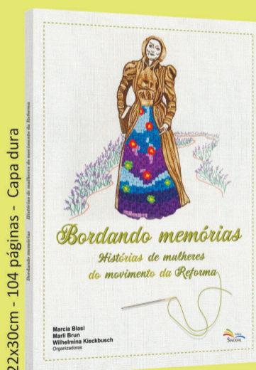
Bordando memórias Histórias de mulheres do movimento da Reforma