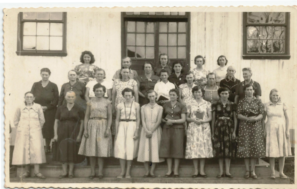
Salgado Filho Paraná/PR

O começo foi tímido, pois as mulheres precisavam se conhecer e compreender a importância da OASE numa comunidade. Este recomeço, das atividades da OASE, foi motivo de grande alegria para toda a comunidade, pois com este trabalho se envolve toda a vida comunitária de-