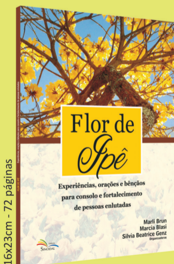
Flor de Ipê Experiências, orações e bênçãos para consolo e fortalecimento de pessoas enlutadas