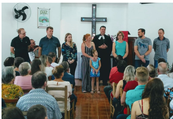
Instalação da Diretoria da Paróquia

No dia 14 de abril realizou-se o Almoço Paroquial de Integração, que é organizado pelo Conselho Paroquial e tendo como local a comunidade de Nova Entre Rios.