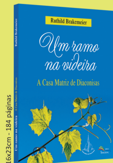
Um ramo na videira A Casa Matriz de Diaconisas