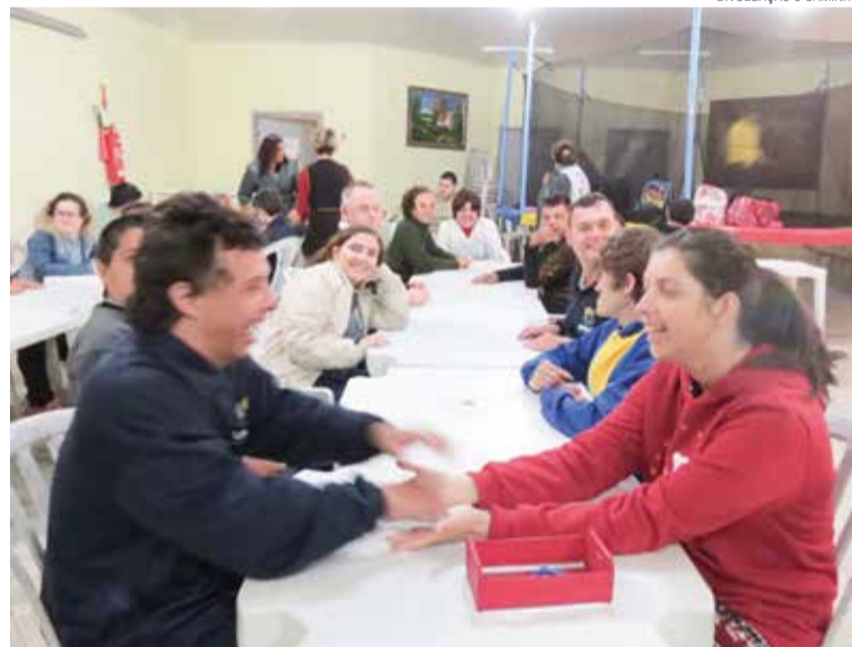
A interação entre as pessoas da Apae e as mulheres é enriquecedora.