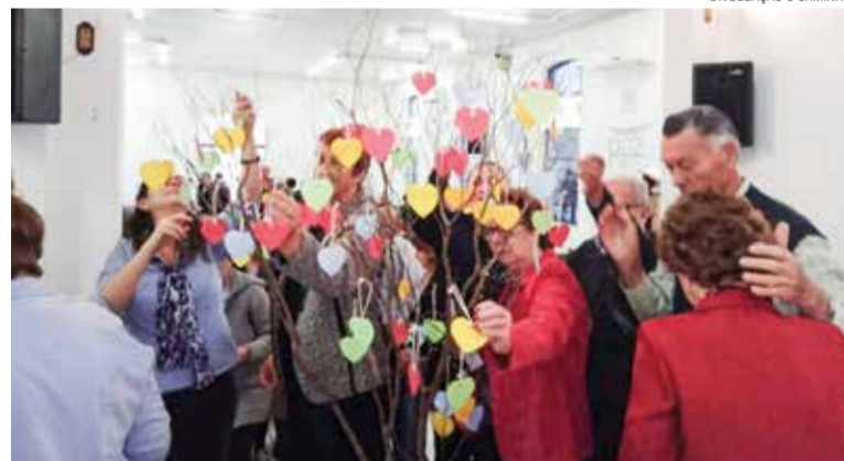
Em Joinville a gratidão foi tema de encontros em agosto, antes do culto.

Após o culto, a comunidade realizou um almoço compartilhado e um bingo, com arrecadação destinada para a Campanha Vai e Vem. ●