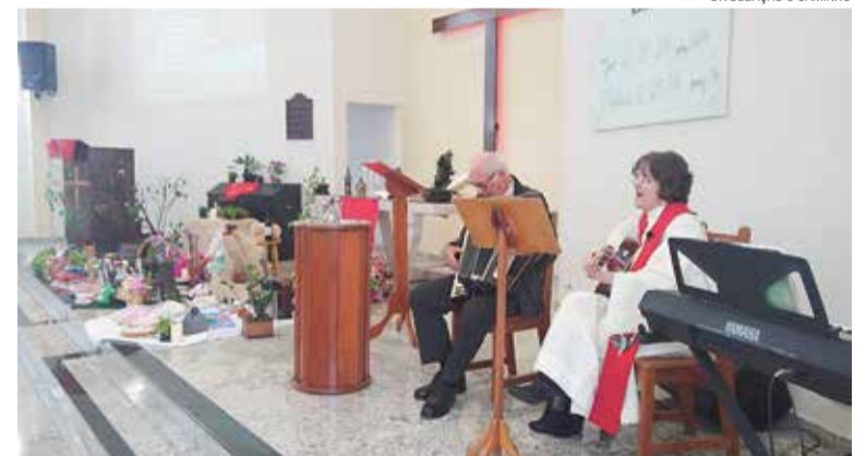
Em Curitiba as crianças distribuíram pedaços de maçãs e biscoitos.