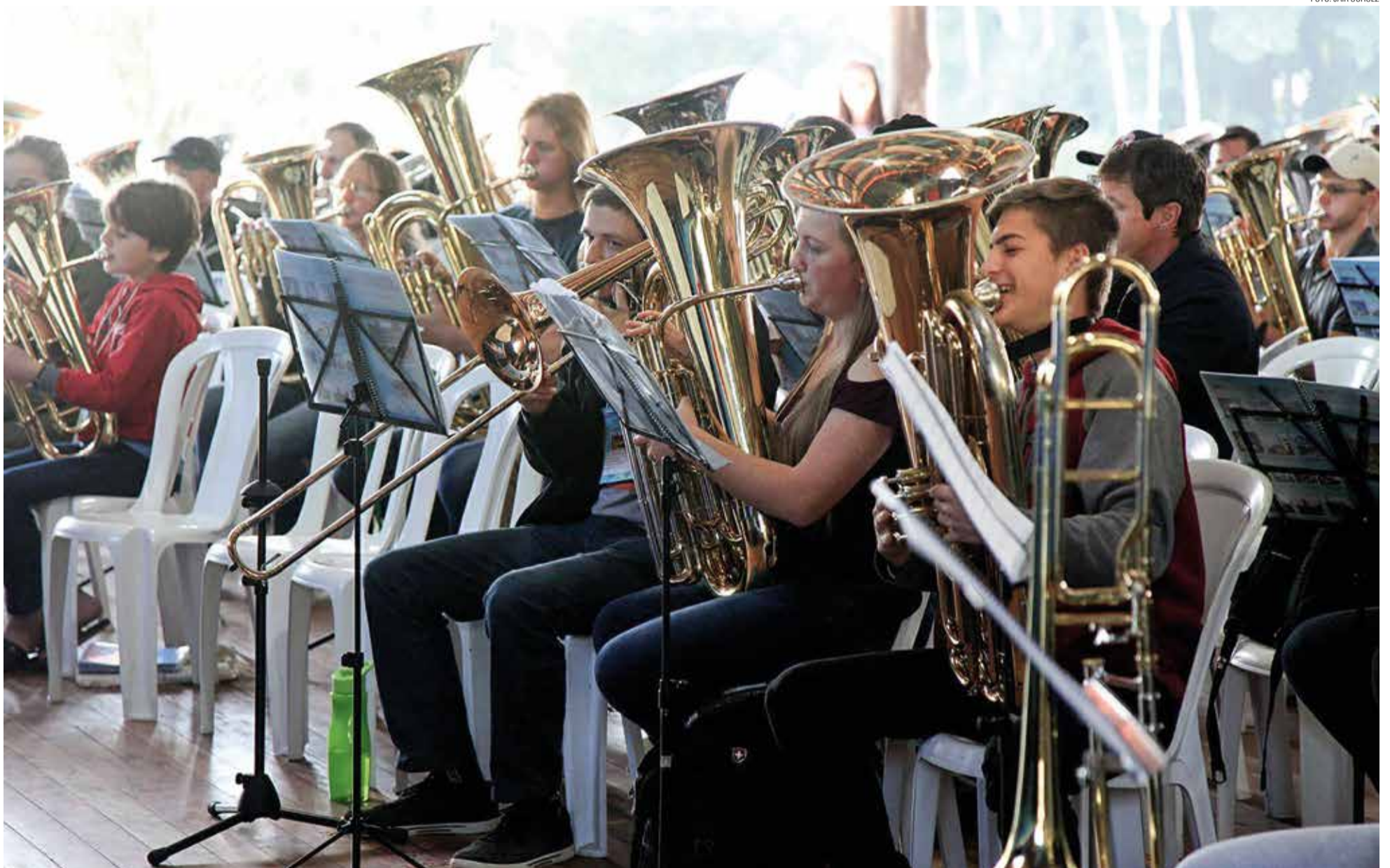
Os grupos de metais vieram de diversas comunidades da IECLB em todo o Brasil, para um encontro nacional que reuniu 600 instrumentistas de diversos naipes.