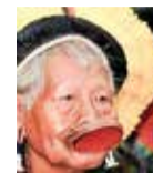
CACIQUE RAONI METUKTIRE , Líder caiapó e ativista ambiental brasileiro.

“NÓS, POVOS DA AMAZÔNIA, ESTAMOS CHEIOS DE MEDO. EM BREVE VOCÊS TAMBÉM TERÃO.”