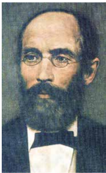
Dr. Blumenau (1819-1899)