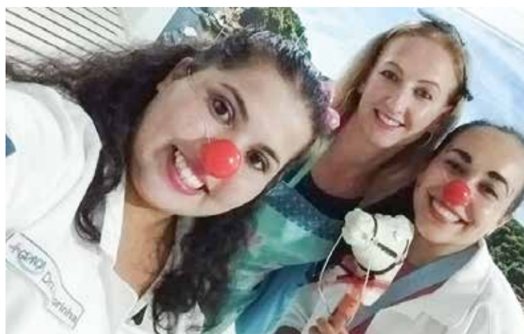
Projeto de universitários anima pacientes em hospitais e lar de idosos.