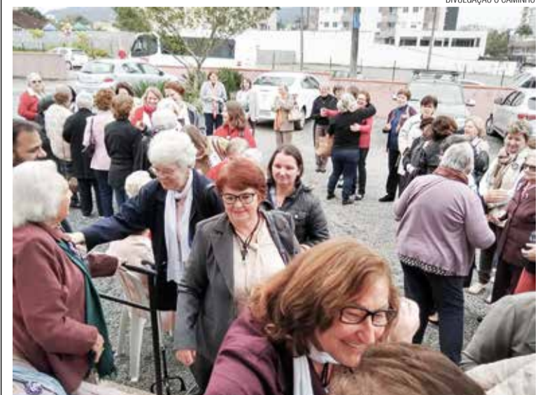
O grupo Violeta recebeu as convidadas com carinho e atenção.

Logo em seguida, os grupos se dirigiram para o salão, onde foi servido um delicioso café colonial. A alegria estava no ar, animadas, as mulheres compartilharam suas histórias. O encontro finalizou com a gratidão a Deus pela tarde tão calorosa e com a certeza de um breve retorno.