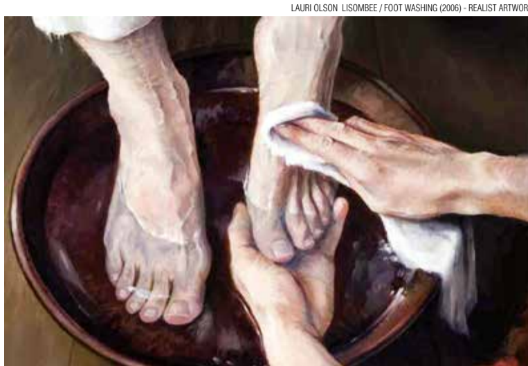
LAURI OLSON LISOMBEE / FOOT WASHING (2006) - REALIST ARTWORK

Der Pharisäer dieser Geschichte (Lukas 18,11-14) hat sich erhöht, sich im Gebet groß gemacht vor Gott. Er hat Ihm alles Gute, das er tat, aufgezählt, und alles Schlechte, was der Zollbeamte tat. Was hat er aber nicht erzählt ? Er hat nicht von seinen eigenen Fehlern geredet, noch eine vielleicht gute Eigenschaft der Zöllner unterstrichen. Der Zöllner , der Zollbeamte, seinerseits hat sich nur auf seine Sünde konzentriert, und sie vor Gott bekannt. Jesus lobt die Haltung des Zöllners, nicht die des Pharisäers. Der Pharisäer übt Kritik, hat aber keine