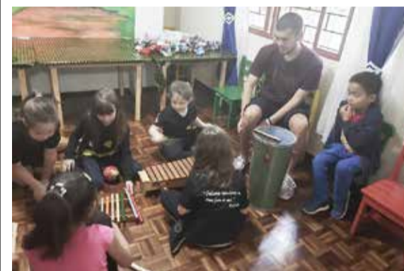
A ampla faixa etária, entre os 3 e os 15 anos, deu o tom do encontro.