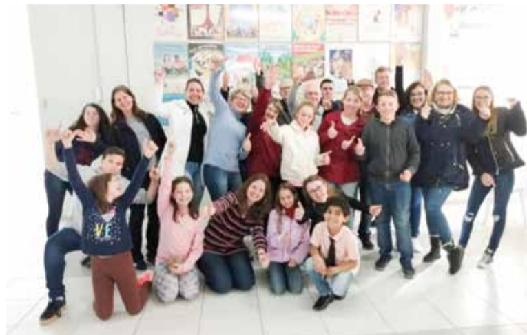
Participantes ficaram entusiasmados com os ensinamentos do dia.

“Acho que temos que instigar também nossas crianças e jovens a participar, porque o