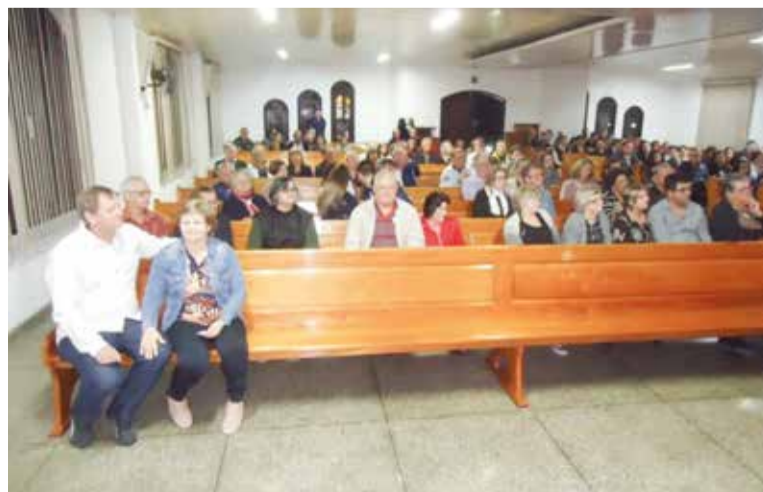
O encontro organizado pelos homens da Lelut reuniu 140 pessoas.