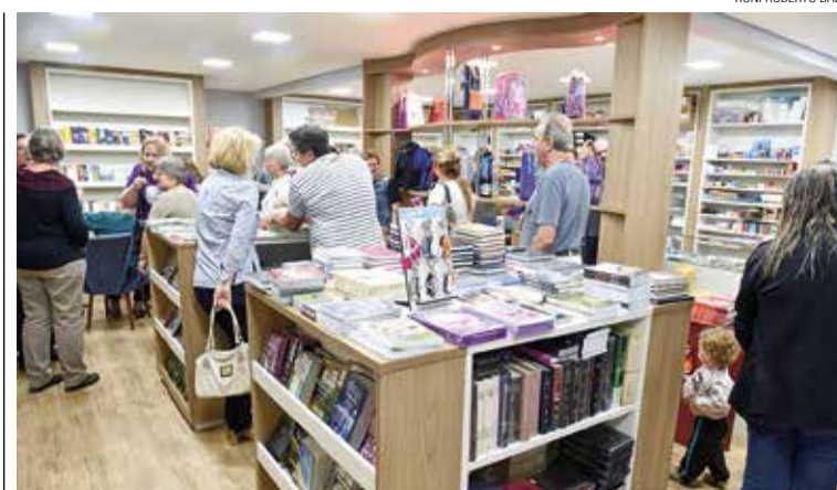
Novo leiaute da loja da Livraria Martin Luther, em Blumenau.