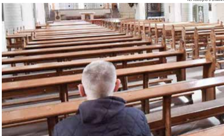
Para o período serão divulgados cultos e celebrações virtuais no Portal

Diante desse quadro, “suspender atividades não é exagero, mas é atitude de responsabilidade com a vida. A propagação