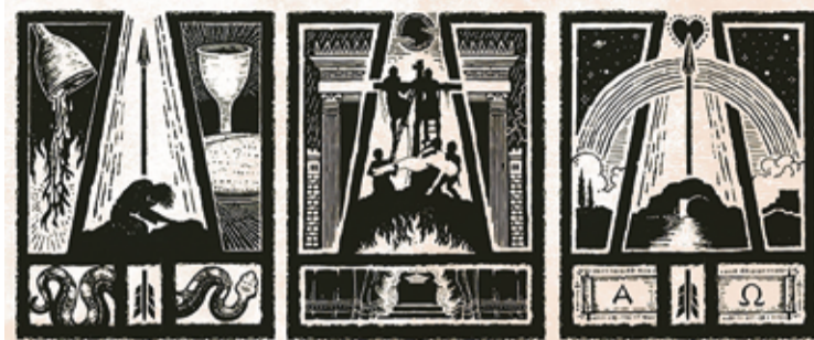
O tríduo Pascal divide as celebrações pascoais a partir da Paixão (primeiro quadro), Morte (segundo quadro) e Ressurreição (terceiro quadro), de nosso Senhor Jesus Cristo.

Quem, como cristão/ã, quer celebrar a Páscoa “de modo correto” naturalmente vai à igreja. E isto, três vezes: Na Quinta-feira Santa, na Sexta-feira Santa e na noite/madrugada do Domingo de Páscoa. Entrementes, não apenas as comunidades católicas, mas também algumas comunidades/igrejas evangélicas celebram o Triduum Sacrum , ou “Tríduo Pascal”. Todas as três celebrações formam um todo, e são compreendidas como um único culto. A celebração inicia com a participação em um culto com Santa Ceia na Quinta-feira Santa à noite. A Santa Ceia lembra a última ceia de Jesus com seus discípulos. No comer e beber, os cristãos simbolizam a comunhão de uns com os outros e com seu Senhor, testemunham seu sofrimento e morte e certificam-se do perdão de seus pecados.