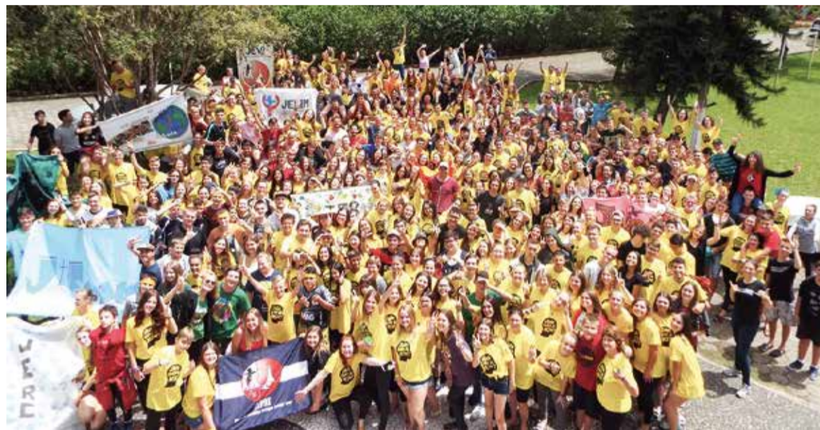
“Quem cuida de mim?”, foi a pergunta dos jovens que participaram da quadragésima edição do Acampa