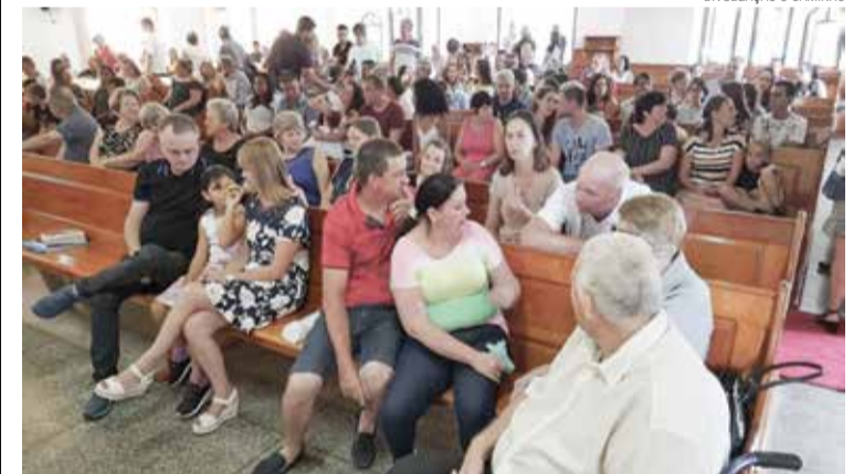
Participantes do culto de lançamento do Jejum diaconal

O convite é para que, ao abster-se de algo, se doe o recurso economizado ao Campos Verdejantes. Em cada templo ou grupo de atividade uma caixinha irá recolher as ofertas do jejum diaconal.