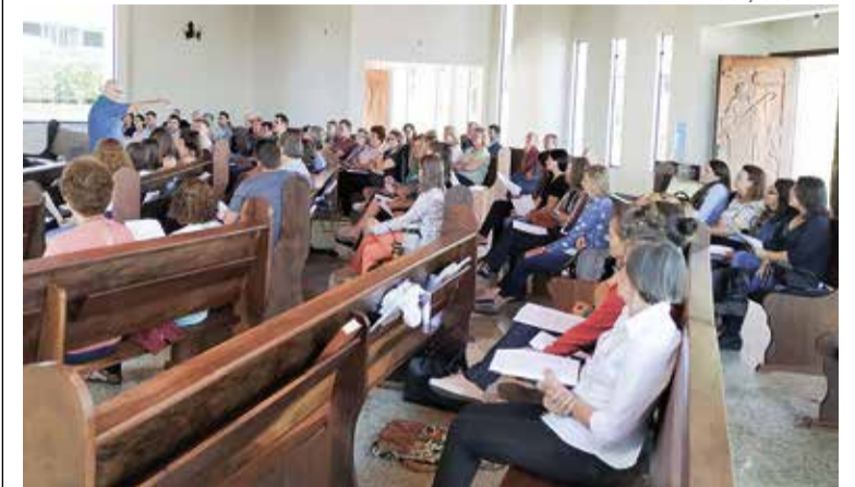
Exercícios de espiritualidade e de liderança estiveram no programa