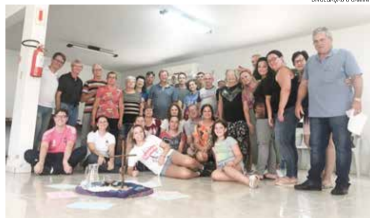
O grupo passou o dia em formação e informação na FELUZ

cas para refletir sobre o tema do Ano da IECLB, “Viver o Batismo”. Além da oportunidade de formação, as lideranças experimentaram momentos de conversas, troca de experiências, comunhão, alegria e boa comida. As lideranças puderam iniciar o ano com muita fé, alegria, comunhão e inspiração para viverem o Batismo.