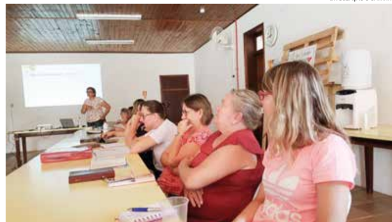
O seminário tratou a temática Bíblia e espiritualidade com as lideranças

momento, conectou histórias de fé e espiritualidade com histórias de vida. Por fim, junto com as lideranças, desenvolveu dinâmicas envolvendo Bíblia e espiritualidade na vida cotidiana e em grupos comunitários. “O próprio seminário foi uma vivência do tema”, afirmou uma participante. O seminário foi promovido pela coordenação da Educação Cristã Contínua do Sínodo Norte Catarinense. E aconteceu no dia 7 de março, na Igreja Martin Luther, em Massaranduba/SC.