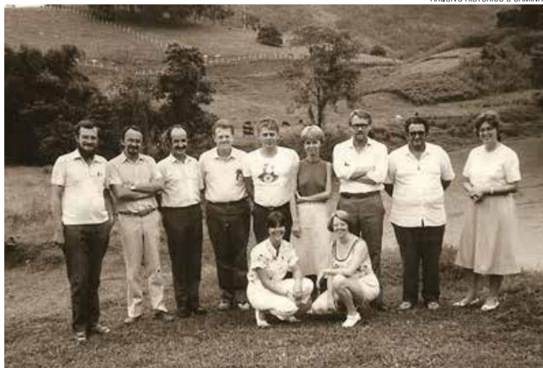
Algumas das lideranças pioneiras que criaram o jornal em 1984, no encontro dos rios onde hoje está o Centro de Eventos Rodeio 12.

“Dentro deste espírito, entendemos a Igreja como pessoas a caminho”, define o compromisso do jornal na primeira edição. Na época, como “órgão de divulgação da Região Eclesiástica 2 da Igreja Evangélica de Confissão Luterana no Brasil”, o jornal assumiu o compromisso de apontar “para aquele que é o