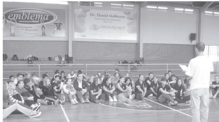
Jovens das diversas comunidades se reúnem para os jogos

Em Ijuí/RS, foi realizado o 6º Torneio InterParoquial da JE. Em cada edição deste evento, reúnem-se jovens das diversas Comunidades da IECLB. Além dos jogos, ocorre um momento de reflexão, desta vez, voltada para o tema proposto para o próximo Congrenaje: "Juventudes, pelo que bate o nosso coração?"