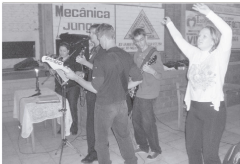
Banda formada pelos jovens tocou músicas de louvor durante meditação

que também teve uma gincana cultural. O almoço foi uma deliciosa galinhada preparada pela comunidade que sediou o evento no Ginásio 25 de Julho. Durante a tarde, o futebol, vôlei, ping-pong e bolão integraram os participantes de forma muito animada. O evento encerrou com a entrega de medalhas às equipes e muito louvor e animação.