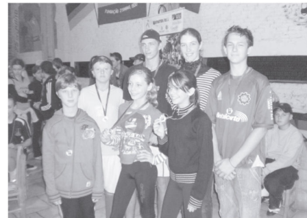
Atividades esportivas mobilizaram os jovens

Uma reflexão, músicas de louvor acompanhadas de banda musical dos próprios jovens marcaram o início do encontro,