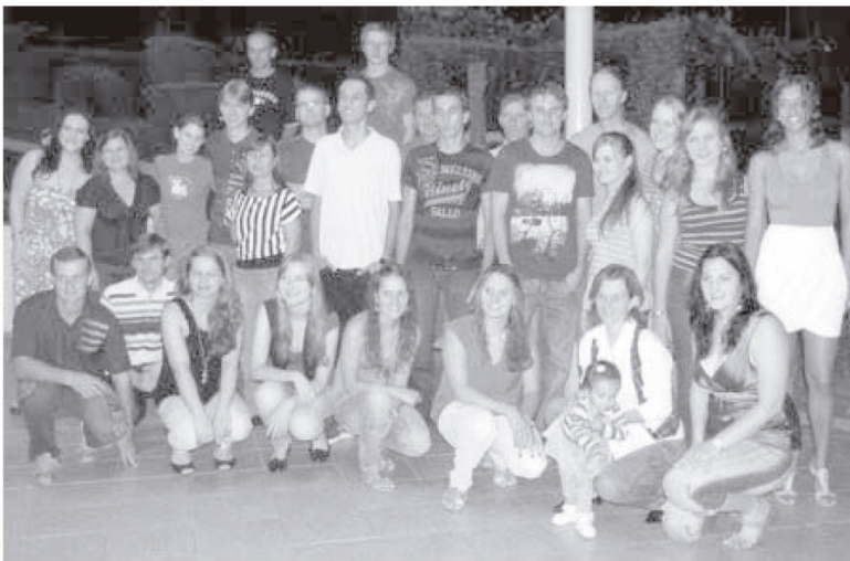
Participaram jovens de todo o Brasil

Ao assumirmos nosso compromisso, somos chamados a ousar, buscando com criatividade meios e formas de trabalhar em nossas diversas realidades. Com ânimo e coragem, seguimos nossa missão com a juventude luterana no Brasil. Ide e anunciai a todos.