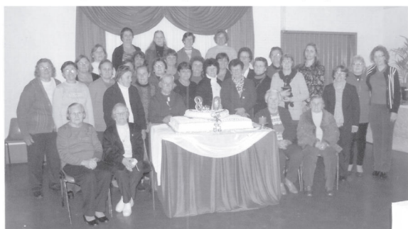
Senhoras do grupo participaram da celebração do aniversário de 80 anos

nhão, o Testemunho e o Serviço, que são pilares da OASE. Baseado nesses pilares as senhoras da OASE, seguindo a orientação de Mateus, sempre estiveram presentes na vida da Comunidade e Paróquia auxiliando os necessitados, visitando os doentes e enlutados.