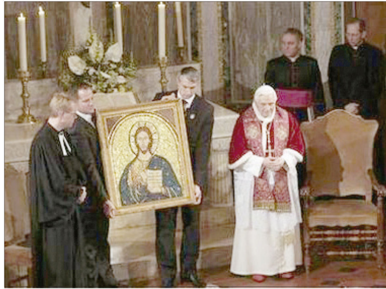
Papa Bento XVI visitou Christuskirche (Igreja de Cristo), a Igreja Luterana de Roma

Bento XVI recorreu à passagem do Evangelho de João 12.20-26 na sua homilia, sobre a necessidade de que o grão morra na terra para dar muito fruto. “Se nós nos relacionarmos assim, se na dor estivermos juntos e se dividirmos e celebrarmos unidos a alegria na fé, este será um passo fundamental para tornar visível e eficaz a unidade que vivemos”, ressaltou o líder católico.