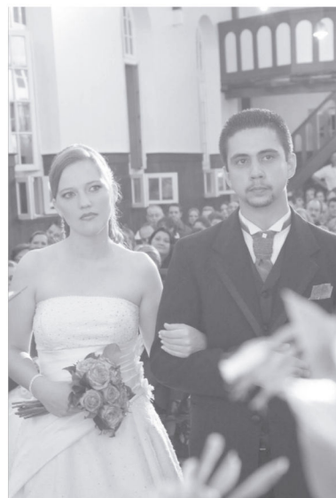
A Comunidade deseja as ricas bênçãos de Deus ao casal.

O texto da mensagem para os noivos foi baseado em Eclesiastes 4.12: "O cordão com três dobras não se rompe com facilidade", fazendo referência ao fato de que Deus deseja fazer parte do matrimônio, tornando-o assim mais forte.