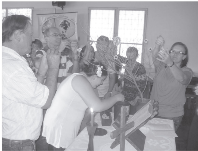
Primeira etapa ocorreu no mês de março

O Pastor Sinodal trabalhou os assuntos a partir da constatação: “...e o que a nossa Igreja fala sobre isso?” Quantas vezes fomos surpreendidos com essa pergunta? Sobre quantas vezes os líderes e a comunidade têm res-