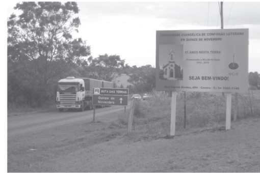
Presença da IECLB foi mostrada nas margens da rodovia que dá acesso à cidade

Aproveitando o potencial turístico da cidade, a comunidade resolveu investir na comunicação visual, colocando às margens da rodovia que dá acesso à cidade uma placa indicando a existência da IECLB. Além de dar as boas-vindas aos visitantes, ao mesmo tempo, este investimento na comunicação visual eleva a auto-estima também dos membros da comunidade.