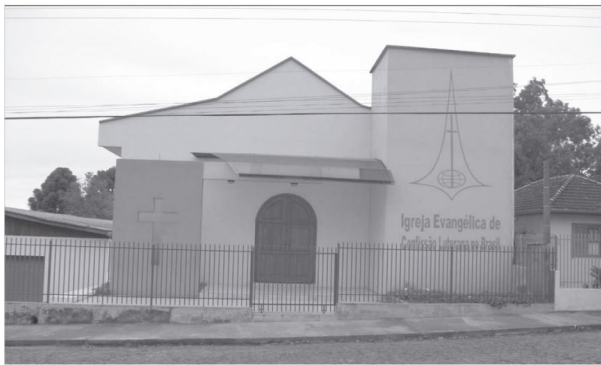
Igreja da IECLB em Palmeira das Missões depois da reforma

Com o decorrer dos anos ocorreu um fortalecimento da Paróquia Evangélica de Chapada, que começou a considerar a possibilidade de abrir um segundo pastorado, sem