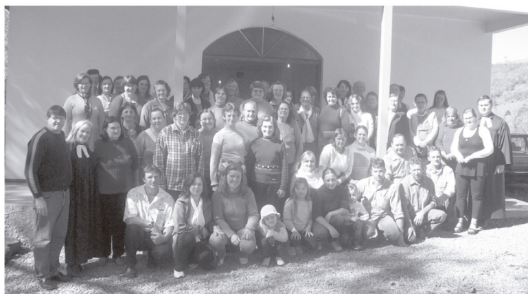
Encontro Paroquial abriu a Semana Nacional do OASE na Paróquia.

A tarde foi celebrado o Culto da Semana Nacional da OASE e terminou com delicioso chá e alimentos que todas trouxeram para compartilhar.