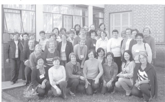
Participantes do Seminário realizado no Lar da Igreja

No final do Seminário as participantes foram novamente lembradas que no mês de junho, na Assembléia da OASE, haverá escolha da nova diretoria, sendo que a atual, pelos estatutos do CNO, não tem direito a reeleição.