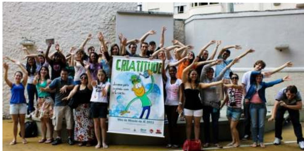
Jovens da IECLB participantes da Cúpula dos Povos, no Rio de Janeiro (RJ), evento paralelo à conferência oficial da Rio+20