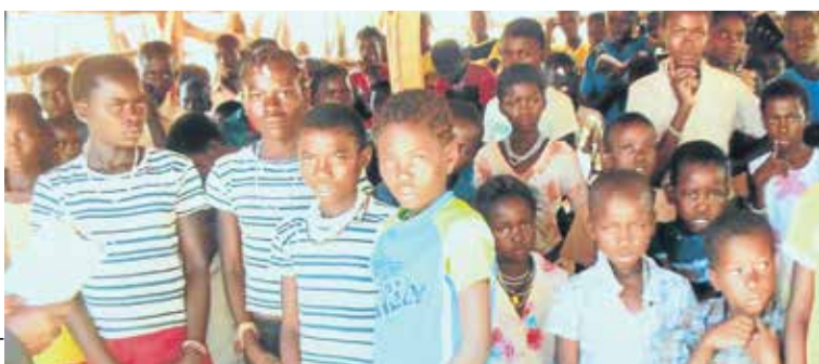
Arquivo P. Sílvia Schneider